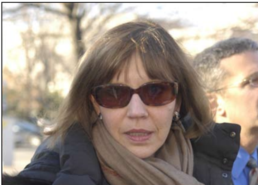
Judith Miller när hon släpptes ur fängelset i september 2005.

Därmed kolliderade utredarna med en av Judith Millers få goda sidor. Hon var och är inte den som röjer en källa och hon fortsätter att