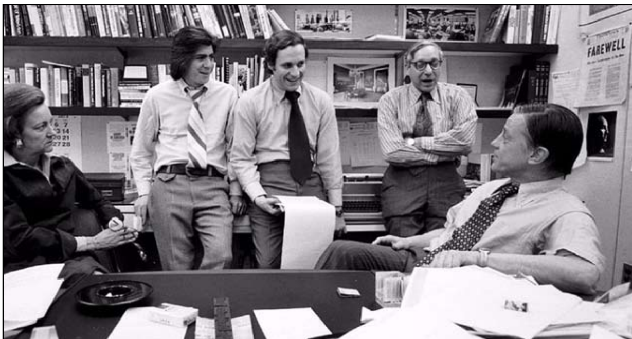
"Woodstein", Woodward och Bernstein med tidningsledningen 1973.

Geijer skandalen (att det fanns en polispromemoria om att justitieminister Lennart Geijer anlitat minderåriga prostituerade) genom att neka, neka och åter neka, vilket slutade med att Dagens Nyheters ledning bad om ursäkt för ett i stort sett riktigt avslöjande och rentav betalade skadestånd till Lennart Geijer. I USA, i efterdyningarna till Watergate skandalen, började ett par Vita Huset-medarbetare vid namn Donald Rumsfeldt och Dick Cheney skissa på en annan motstrategi: att regeringen medvetet skulle odla kontakter med journalister, redaktörer och medieägare. De som ansågs som sympatiskt inställda skulle gynnas genom att regelbundet matas med allehanda nyhetsmässiga godbitar. Journalister som envisades med att avslöja oönskade nyheter eller gräva fram misshaglig information skulle däremot mobbas ut. De inbjöds inte att komma in till viktiga presskonferenser eller tilldelades regelmässigt dåliga platser, fick inga möjligheter att intervjua Människor Som Räknas, tvingades gå långa omvägar genom byråkratin för att få fram viktig information.