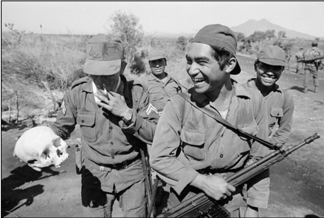
Regeringssoldater i El Salvador. En verklighet som behövde städas undan.